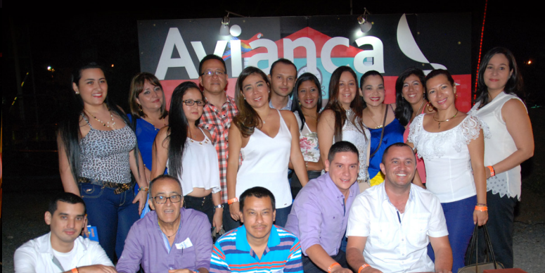
La gerencia de la empresa de transportes Sultana del Valle SAS, invitó a 22 empleados administrativos de Cali y Candelaria, a celebrar la despedida de fin de año.