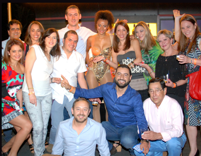
Estos compañeros de trabajo de Intel llegaron desde Bogotá para disfrutar del show, decidieron venir, porque ya han ido a otros países a conocer sus culturas y no podían dejar de venir al que ellos consideran el mejor espectáculo del país.