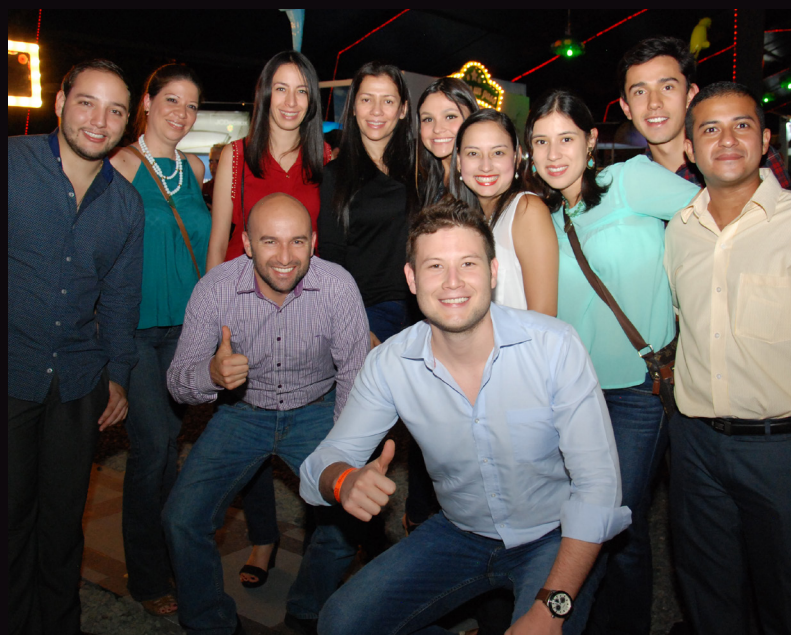
La Carpa fue el escenario para que colaboradores de LaFrancol hicieran su fiesta de integración.